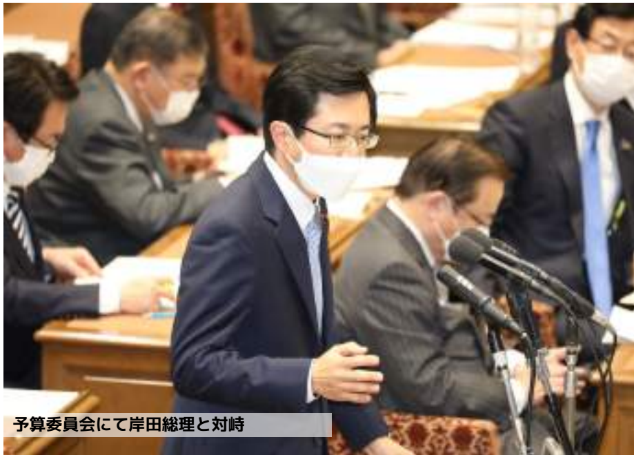
予算委員会にて岸田総理と対峙