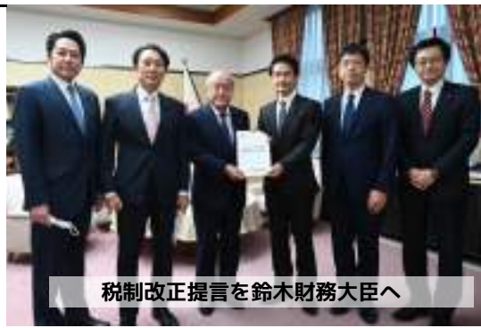
税制改正提言を鈴木財務大臣へ