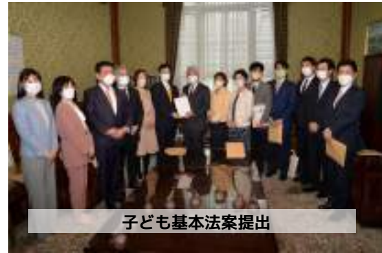
子ども基本法案提出