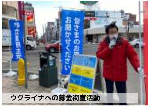
ウクライナへの募金街宣活動