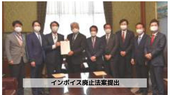
インボイス廃止法案提出