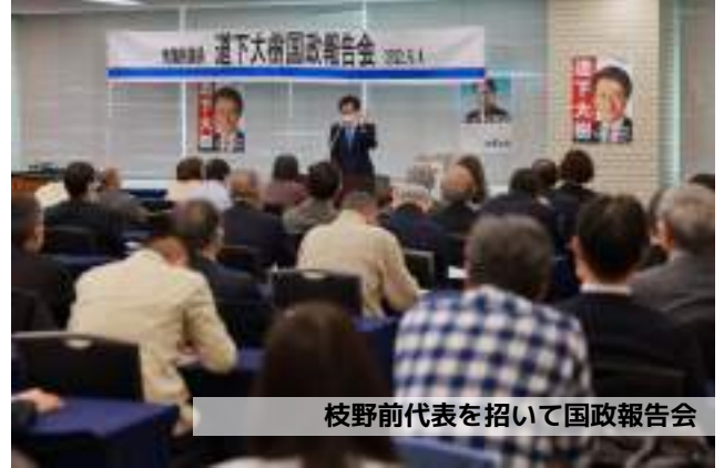
枝野前代表を招いて国政報告会