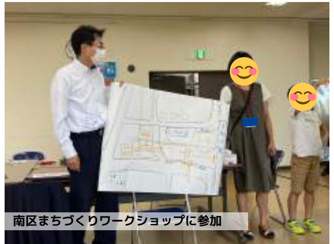
南区まちづくりワークショップに参加