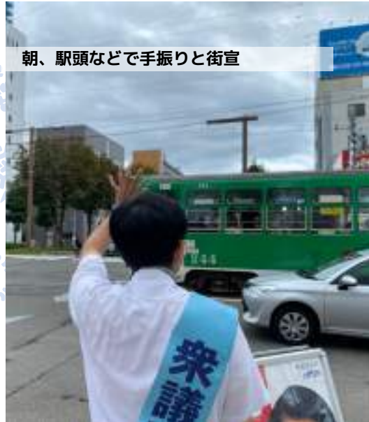
朝、駅頭などで手振りと街宣